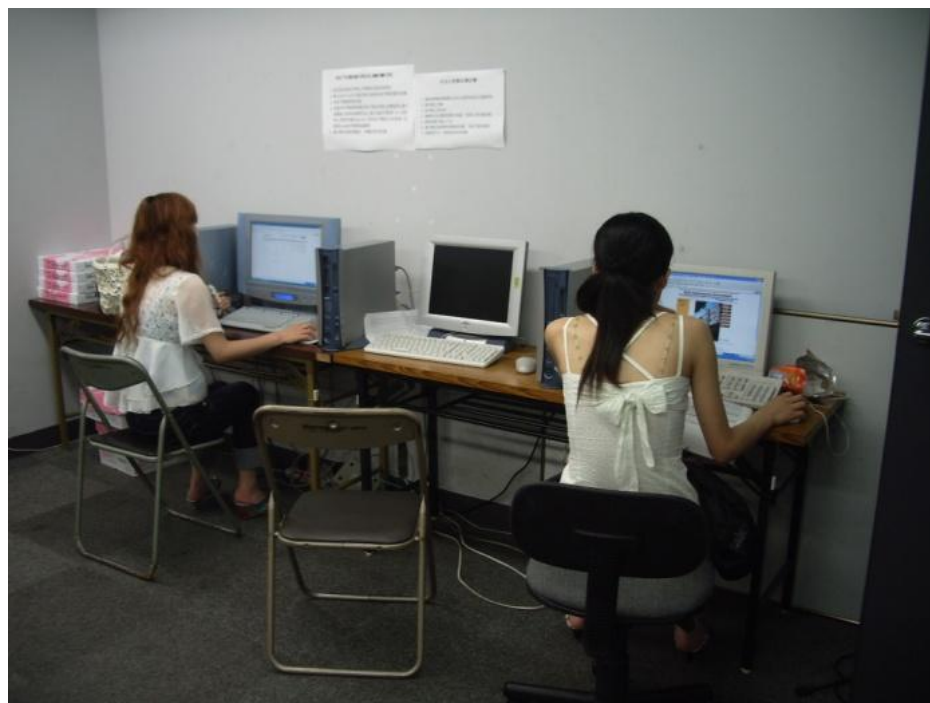
学生自习室，备有计算机、宽带等设备。