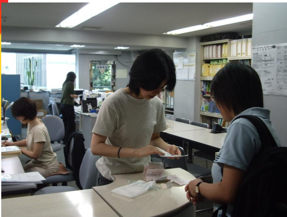
学校事务局；职员在接待学生